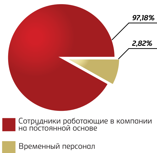
Соотношение сотрудников ОАО «Пивзавод Оливария» по форме занятости

ОАО «Пивзавод Оливария» содействует предотвращению любых форм дискриминации и принудительного труда, не допускает использование детского труда.